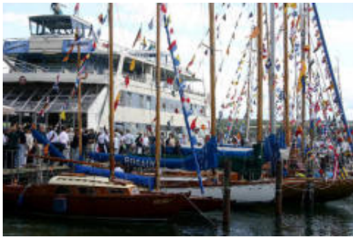
Fähre trifft Oldtimer: Szene vom Yachtclub-Jubiläum.

Schöne alte Boote und die Fähre Fontainebleau auf Abwegen: Der Konstanzer Yachtclub hat sein 100-jähriges Bestehen am Wochenende zwanglos und freundschaftlich gefeiert. Viele Gäste von benachbarten Vereinen waren dabei, und OB Horst Frank zeigte sich beeindruckt von der umfangreichen Jugendarbeit des Traditionsclubs.